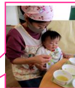
食事・授乳スペース