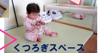
くつろぎスペース