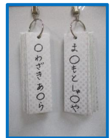
〇の中に入る文字は、

また、お当番表も作りました。名前的一部分をわざと抜かして書いています。この人の名前は誰でしょうか？と聞いてみると最初は皆「え？」「誰だろう？」と首をかしげていましたが、一文字抜けている事に気づくと「あ！〇〇くんの名前だ！」「次は誰だろう」とクイズを解くように楽しんでいました。数字と同じように、文字にも楽しく触れ、興味や関心を高めていきたいです。