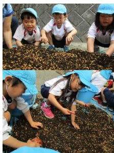
まぜまぜ まぜまぜ