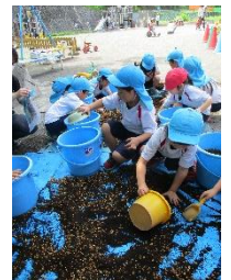
バケツに入れるぞ！！