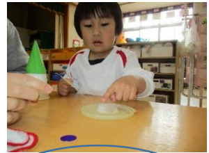
のりを人差し指で塗るのが上手になってきました!